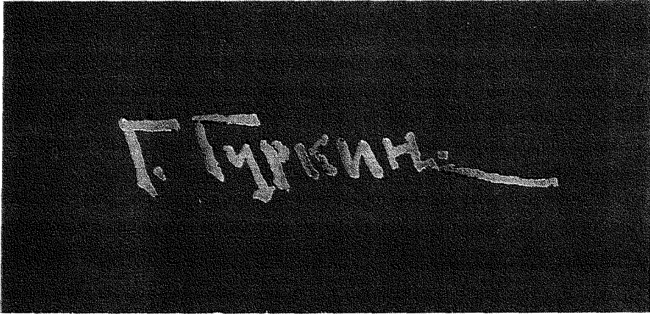
G.I.Çoros Gurkin'in resimlerinde kullandığı imzası.