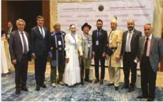
(Ödül töreni üyeleri toplu fotoğrafı:)